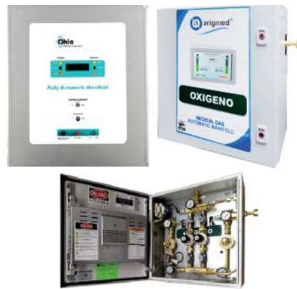
MANIFOLDS PARA GASES