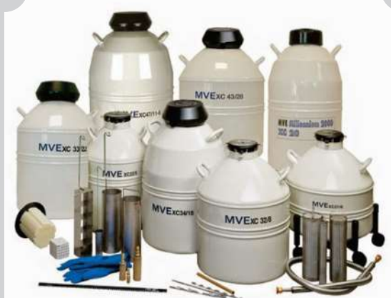
TERMOS CRIOGÉNICOS PARA NITRÓGENO