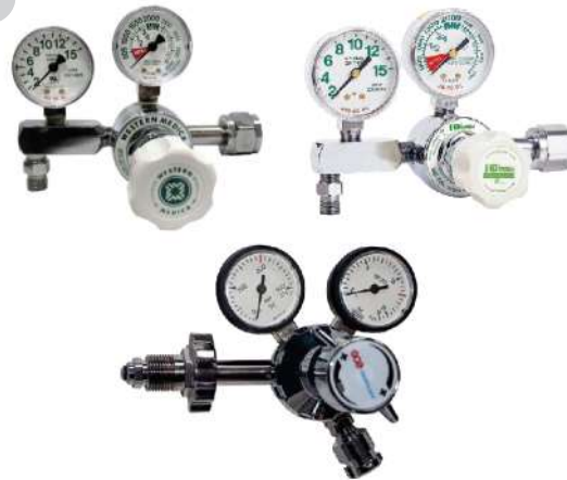
REGULADORES DE DOS RELOJES