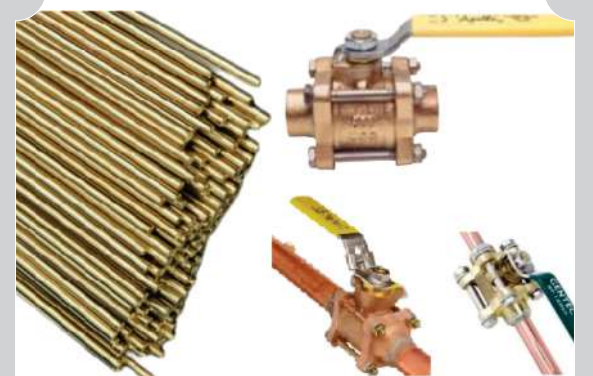
SOLDADURA Y VÁLVULAS DE SECTORIZACIÓN