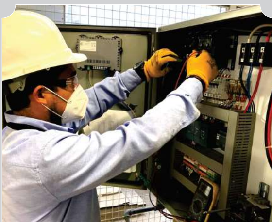
MANTENIMIENTO BOMBAS DE VACIO