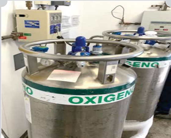
INSTALACIÓN DE SISTEMA CENTRALIZADO LIQUIDO - TERMOS