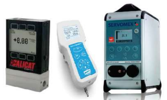
CONTOMETRO Y ANALIZADOR DE OXIGENO