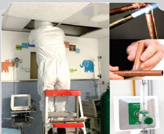
SERVICIO DE REPARACIÓN EN RED DE TUBERIA (FUGAS, CAMBIO DE TOMAS DISS, ETC)