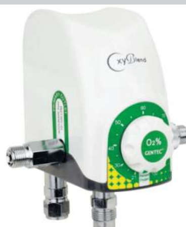
MEZCLADOR DE GASES