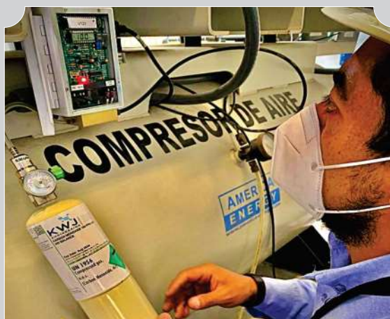
MANTENIMIENTO COMPRESOR DE AIRE