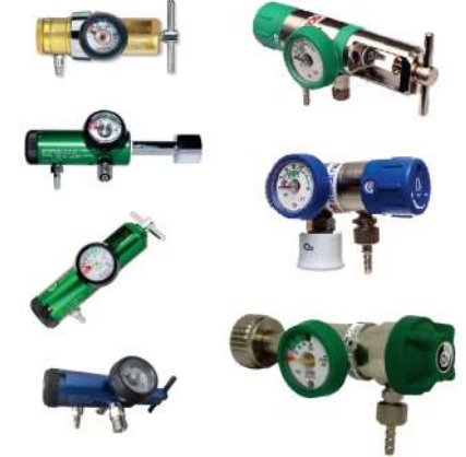
REGULADORES TIPO CLICK