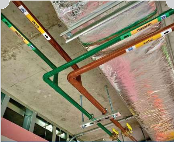
RED DE TUBERIAS DE COBRE PARA GASES