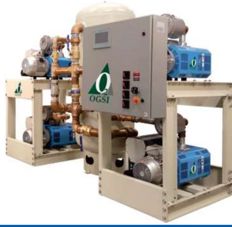
BOMBA DE VACIO