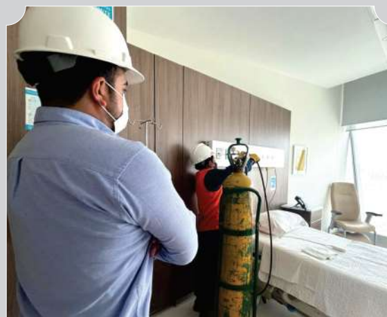
PRUEBAS DE HERMETICIDAD