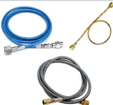
MANGUERAS PARA GASES (PIGTAIL, TRENZADO Y PVC)