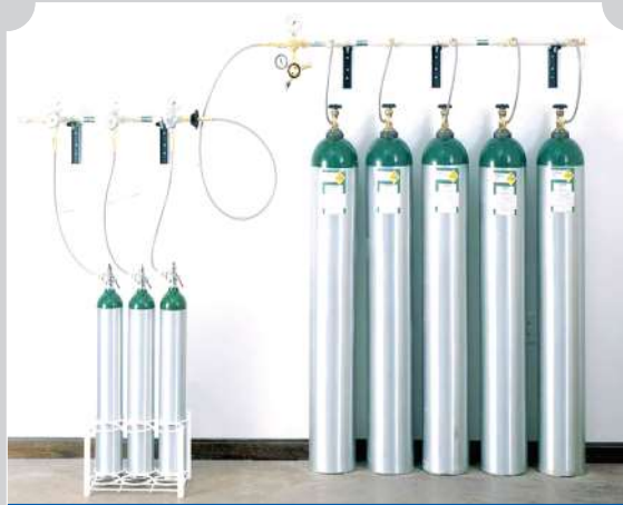
INSTALACIÓN DE SISTEMA TRANSIFLING GASEOSO (TRASIEGO)