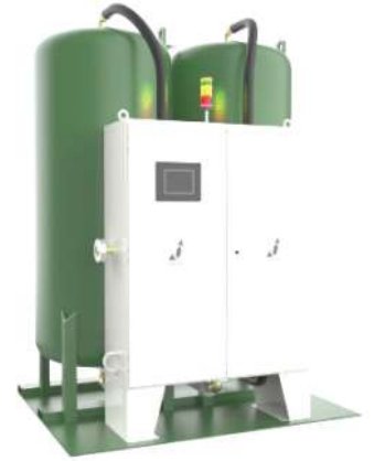
PLANTA GENERADORA DE OXIGENO MEDICINAL GASEOSO (PSA)