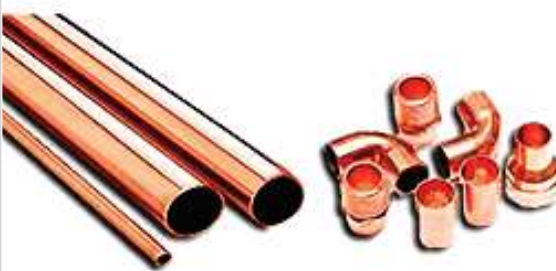
TUBERIAS Y ACCESORIOS DE COBRE