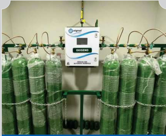
INSTALACIÓN DE SISTEMA CENTRALIZADO GASEOSO