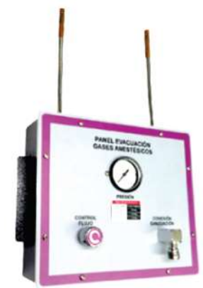
SISTEMA DE EVACUACIÓN DE GASES ANESTÉSICOS