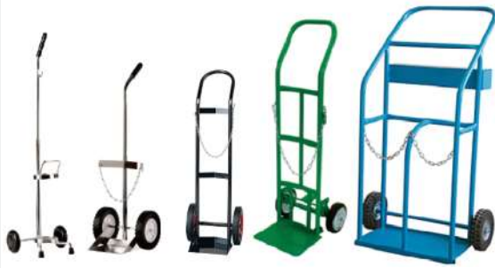
COCHES DE TRANSPORTE PARA CILINDROS