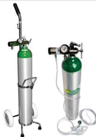
KIT DE OXIGENOTERAPIA PORTATIL