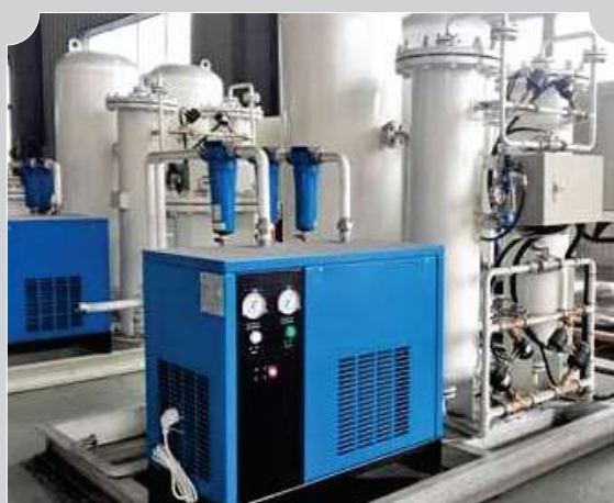
MANTENIMIENTO DE PLANTAS GENERADORA DE OXIGENO (PSA)