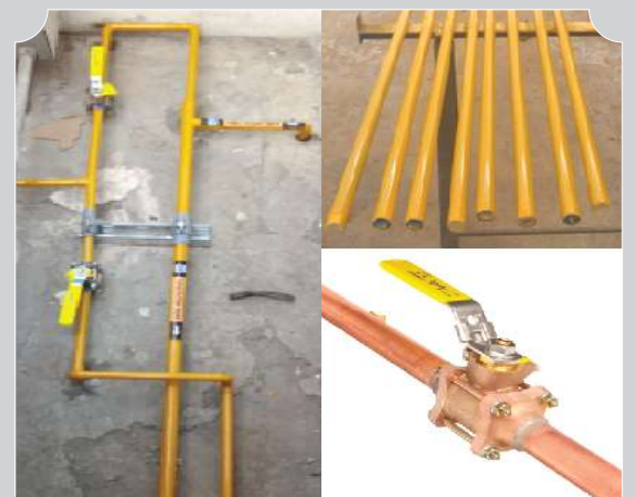
MANTENIMIENTO RED DE TUBERIA (PINTADO, SEÑALIZACIÓN, CAMBIO DE SOPORTES, ETC.)