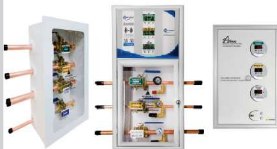
CAJAS DE VÁLVULAS PARA SECTORIZACIÓN