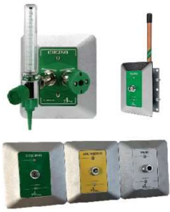
TOMAS DE PARED DISS PARA GASES MEDICINALES