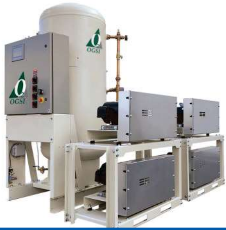
COMPRESOR DE AIRE MEDICINAL