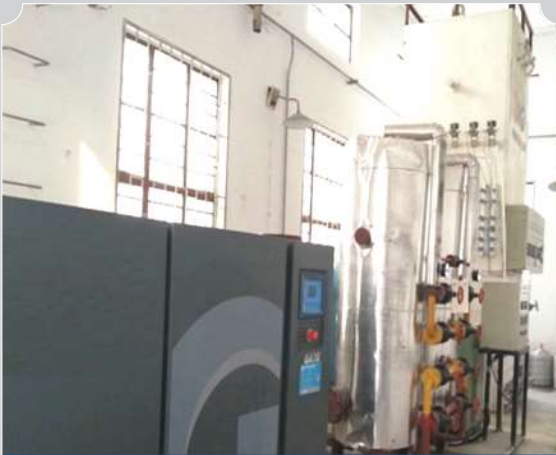
PLANTA GENERADORA DE OXIGENO MEDICINAL LIQUIDO (CRIOGENICA)