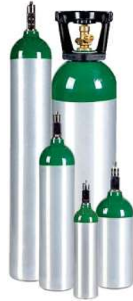
CILINDROS DE ALUMINIO PARA GASES