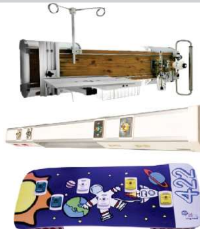
PANELES DE CABECERA Y ESTATIVAS