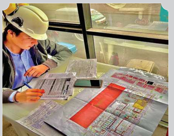
ASESORÍA EN DISEÑO Y DIMENSIONAMIENTO DE REDES Y SISTEMAS CENTRALIZADO