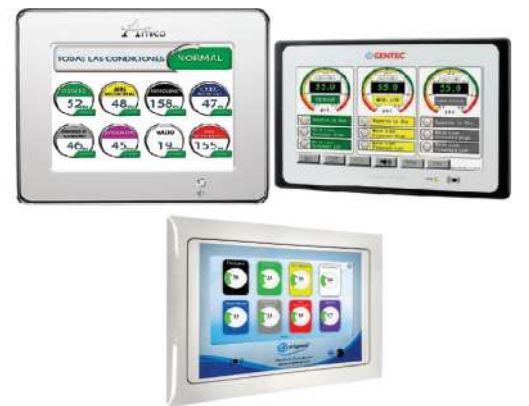
ALARMAS PARA GASES