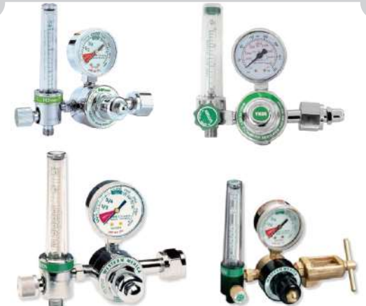
REGULADORES CON FLUJOMETRO DE TUBOK