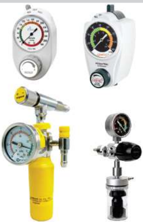
REGULADORES DE VACIO