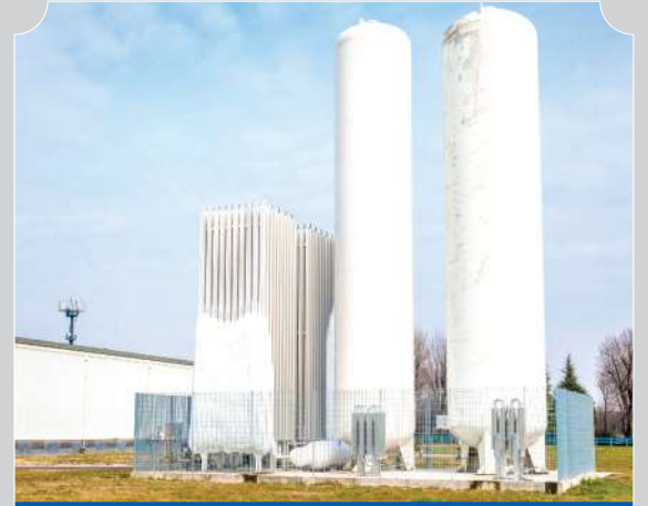
INSTALACIÓN DE SISTEMA CENTRALIZADO LIQUIDO - TANQUES