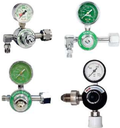
REGULADORES DE ALTA PRESION