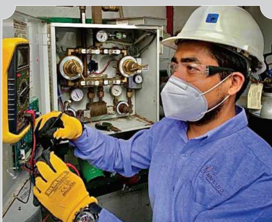
MANTENIMIENTO INTEGRAL AL SISTEMA CENTRALIZADO