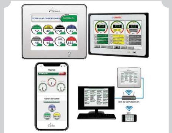
INSTALACIÓN DE SISTEMA DE ALARMA CON MONITOREO REMOTO