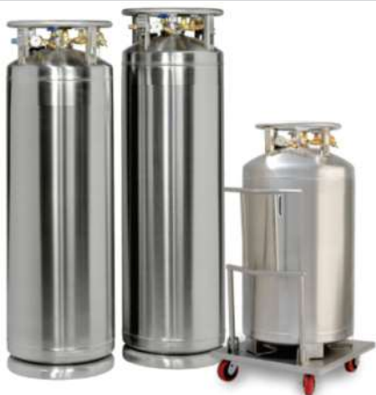
TERMOS CRIOGENICOS (DEWARS)